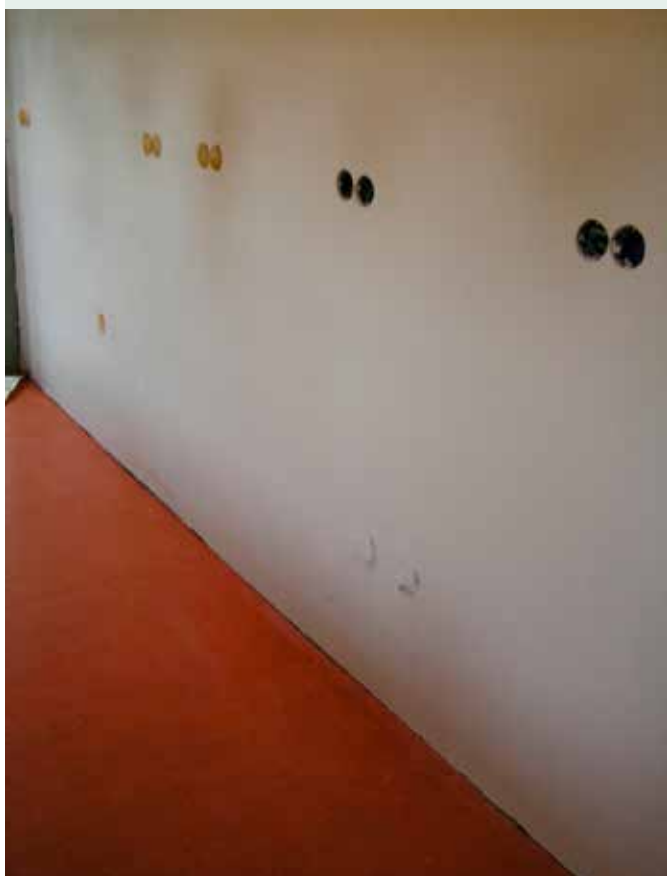
In januari hebben Thom en Hanoy hard gewerkt om alle leidingen weg te werken en de muur te stucen.