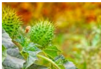
Bloem en zaaddozen doornappel

Nu niet gelijk in paniek raken en je planten weggooiën na het lezen van dit stuk, maar eet er niet van en/of draag handschoenen. Weet je niet zeker of je van een plant kunt eten, check het op Google of soortgelijke zoekmachine.