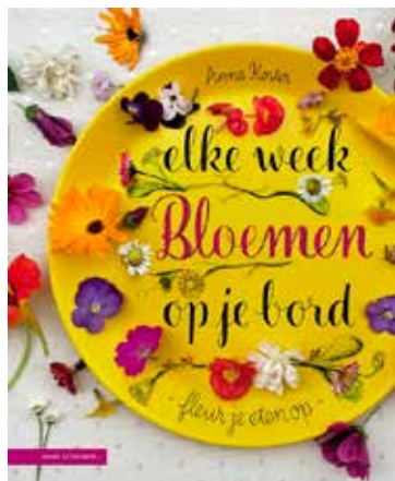
Elke week bloemen op je bord. Fleur je eten op.

In de minigids staan 50 eetbare bloemen, voor toepassing in de keuken. Er staan bekenden in zoals het komkommerkruid, de goudsbloem, de vlier, de dovenetel en de paardenbloem, maar wist je dat je ook de fuchsia, de begonia, de palmlilie, de pioenroos of de hosta in je eten kunt verwerken. De planten in deze minigids zijn handig ingedeeld naar seizoen en smaak; toepassing en bijzonderheden worden vermeld (geen recepten). Zelfs de orchidee komt aan bod. Veel bloemen kunnen aan salades of taarten worden toegevoegd, maar ook desserts en sandwiches worden genoemd. En soep; de Japanse sierkwee b.v. kan in de snert.