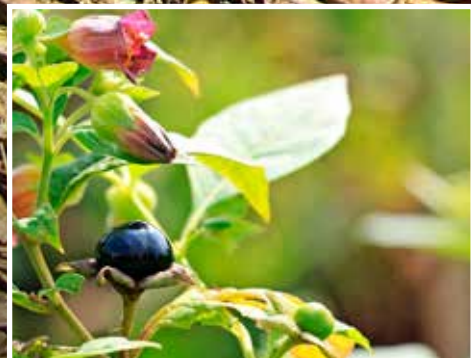
Weten wat je kunt eten! - pagina 4 De buitenwereld - pagina 7

zaterdag 17 mei 2025 Algemene Leden Vergadering Zie pagina 22