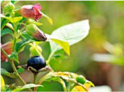
Bloem en bes van atropa belladonna

eten van deze bessen kan tot hallucinaties leiden en zelfs stuipen veroorzaken. Op https://www.naturetoday.com/intl/nl/nature-reports , zoekfunctie wolfskers - 13 oktober 2024, is een uitgebreid artikel over wolfskers terug te lezen.