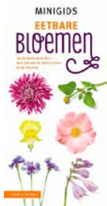
Minigids Eetbare bloemen - 50 eetbare bloemen - met smaak en toepassing in de keuken

Beide boeken verkrijgbaar bij KNNV Uitgeverij.