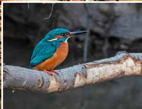
De Ijsvogel - pagina 10 Houtstook - pagina 14