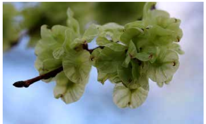
Zaden van de iep, veroorzaker van de springsnow

De top 10 van meest voorkomende boomsoorten in Amsterdam is: iep, linde, esdoorn, es, plataan, eik, populier, els, wilg, berk. De meest voorkomende boom is de iep. Iepen zijn zeer geschikt voor in de stad met hoog grondwater, bestrating, luchtvervuiling en voortdurende graafwerkzaamheden. We zijn 'iepenhoofdstad van Europa'. Gelukkig is de iepenziekte vrijwel onder controle. De ongeveer 75.000 iepen - met meer dan 50 verschillende soorten - zorgen voor een groene, leefbare stad. Dat was vroeger vooral om de lucht van open riolen te neutraliseren.