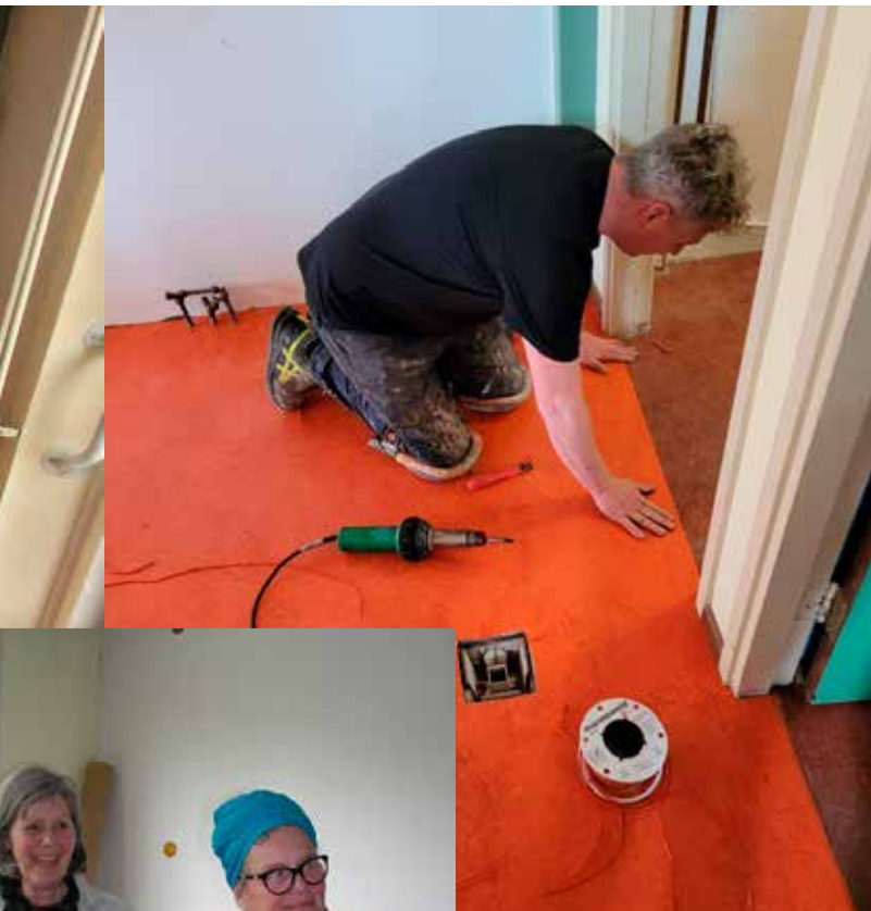
Er wordt nieuw linoleum gelegd.