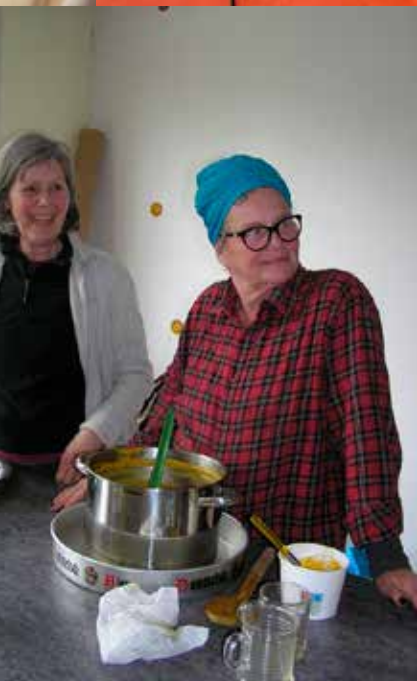
En het is behelpen in een afgebroken keuken, maar soep moet er zijn voor de winterwerkbeurters!