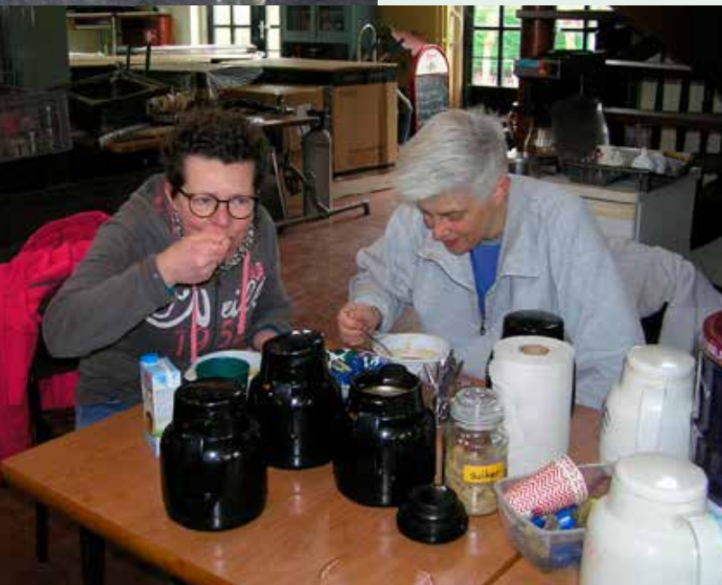
En het resultaat smaakt uitstekend.