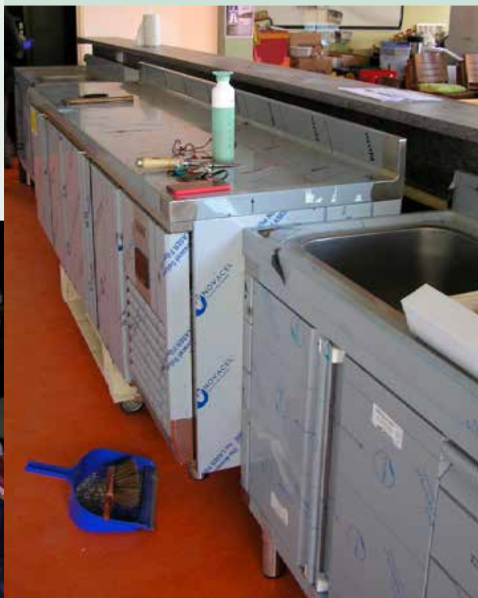
Half maart. Een deel van het nog ingepakte keukenmeubilair staat op z'n plek.