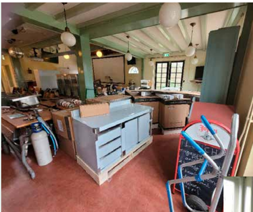
Stukje bij beetje komen de onderdelen voor de nieuwe keuken binnen.

Het werk aan de keuken in de boerderij is in volle gang. Veelal door vrijwilligers, soms door vaklui, zoals de aanleg van elektra, het stucen van de muur en het leggen van nieuw linoleum. Nieuwe kasten en werkbladen zijn geleverd en deels op hun plek gezet. Alles netjes afgeplakt tegen beschadiging, maar alleen het verwijderen van het afplak-materiaal is een klus op zich. Er wordt hard gewerkt om alles op orde te hebben vóór de voorjaars ALV.