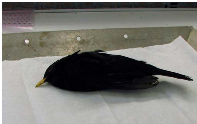
Merel met usutu-virus

virus komt oorspronkelijk uit Afrika en is vermoedelijk via trekvogels in Europa beland. Het komt voor bij verschillende zangvogels en uilen. Een merel, die besmet is geraakt met het virus ziet er ongezond en verzwakt uit. Verder hebben ze evenwichtsstoornissen en kunnen ze soms moeilijk vliegen. Na enkele dagen zijn ze dood.