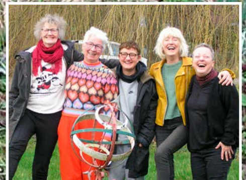
Thea's WWWeetjes Bestuurlijke zaken