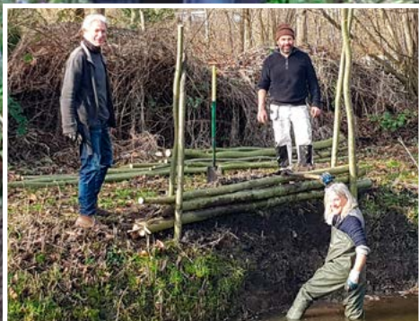
De Buitenwereld De IJsvogelwand

zaterdag 3 juni 2023 Algemene Leden Vergadering 14.00-16.00 uur