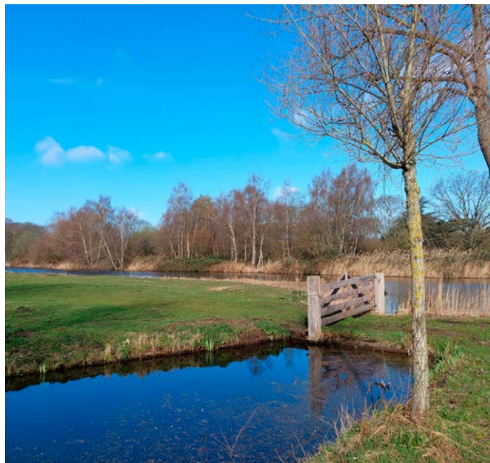
Wordt de Hoofdgroenstructuur wel hard genoeg beschermd?

Volgens het gemeentebestuur is in het nieuwe beleidskader de oppervlakte beschermd groen uitgebreid met groene verbindingen en met beschermd blauw (water) en is de bescherming aangescherpt. Volgens de referenduminitiatiefnemers wordt de bescherming van het groen juist flexibeler gemaakt en bevat het stuk te weinig garanties tegen aantasting van het beschermde groen. U hoeft echter nog niet definitief te weten wat u er zelf van vindt en hoe u gaat stemmen. Wat er nu eerst moet gebeuren is dat het referendum er echt komt. Om dat te ondersteunen kunt u uw digitale handtekening zetten op de gemeentelijke website www.amsterdam.nl en daar dan de zoekterm 'Referendum Hoofdgroenstructuur' intypen. ■