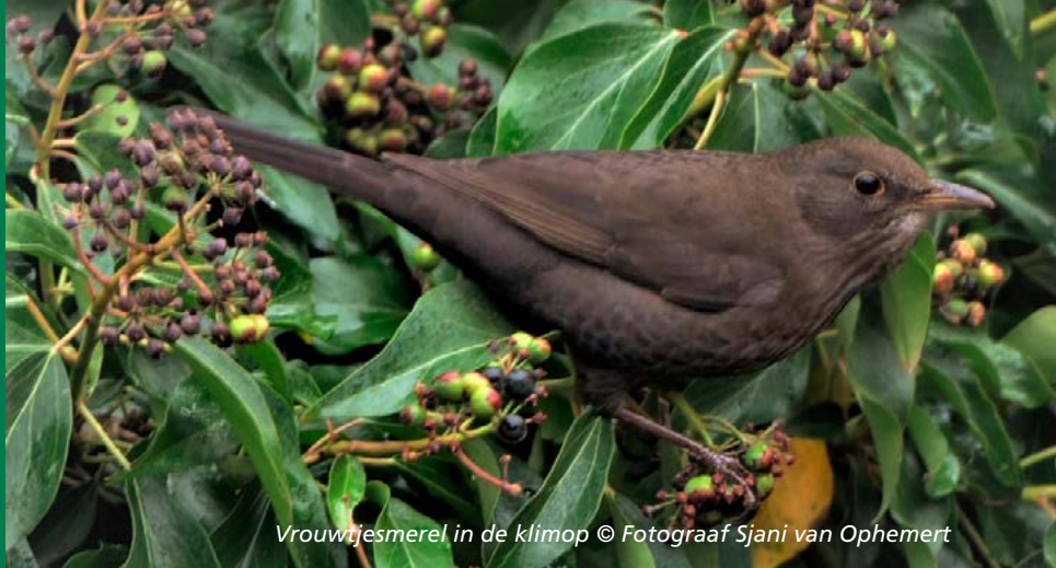
Vrouwjesmerel in de klimop

Het gaat niet goed met onze talrijkste broedvogel, de merel. Sinds 2016 is het aantal exemplaren met bijna 30 procent afgenomen. Om uit te zoeken wat er aan de hand is was heel 2022 het 'Jaar van de Merel'.