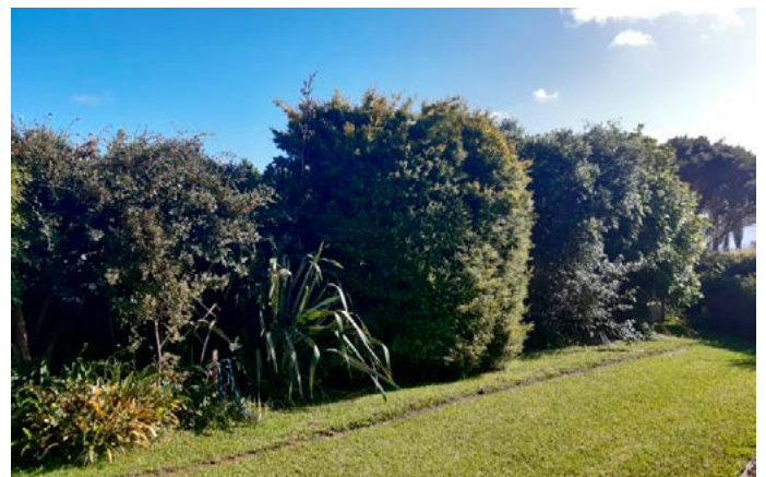
Veel bomen en struiken geven veel (snoei)werk

In Nieuw-Zeeland was het in de Jaren '60 en '70 van de vorige eeuw heel normaal om een huis te hebben met 1000m 2 grond en sommige mensen hadden dan wel een groentetuin maar er was veel beplant met bomen en struiken. Wij hadden het geluk een oom te hebben met